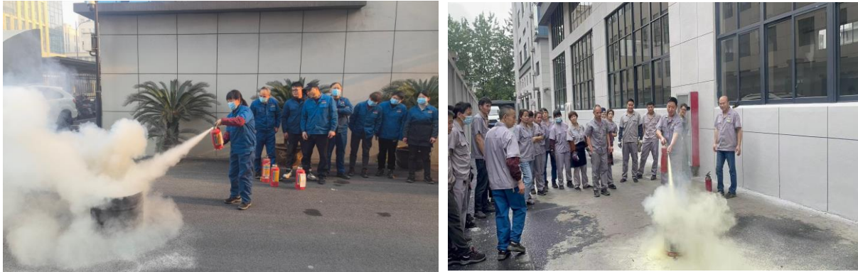
图 6.3-01 消防演练现场

案》等应急预案、《触电事件应急预案》、《重大设备故障应急预案》等应急处置方案等，对火灾、机械、触电等均有相应的应急措施，并成立了应急指挥中心和应急救援专业组。