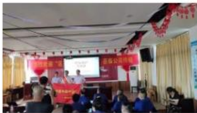
现场急救知识培训

公司将员工学习和发展视为“投资”，把创建学习型组织，营造全员学习的氛围作为公司长期发展战略的重要组成部分。随着公司规模扩大和全球化发展战略的实施，根据企业相关规定及各部门要求确定培训人员的需求情况。各部门负责人确定人员培训需求后经公司领导审批，相关部门每季度根据人员数量酌情进行培训计划的制定与实施。公司并成立了“唐能阀业商学院”，见图 3.2-1 所示。